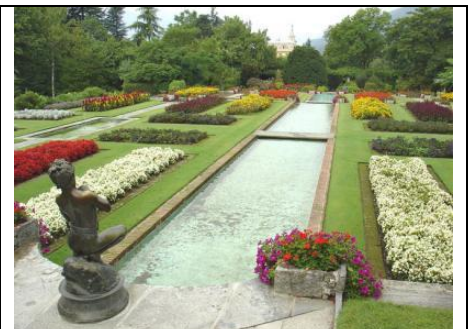
LES JARDINS TARANTO