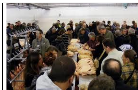
Marché au foie gras SAMATAN