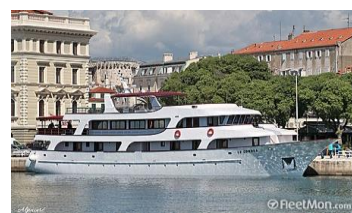
Yacht : LE CORDEA

Inscriptions : avant le 12 octobre 2013 à l'aide du bulletin d'inscription ci-dessous