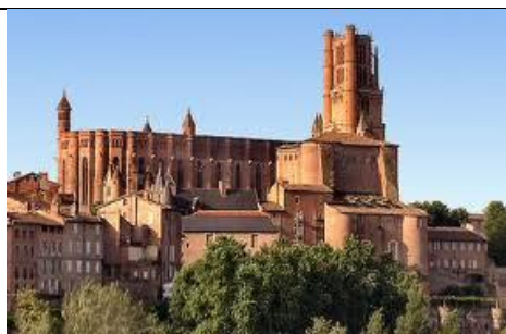
ALBI : Cathédrale Ste Cécile